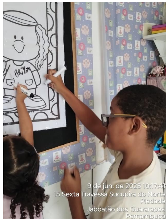
9 de jun. de 2025 10:17:41 15 Sexta Travessa Sucupira do Norte Piedade Jaboatão dos Guararapes Pernambuco