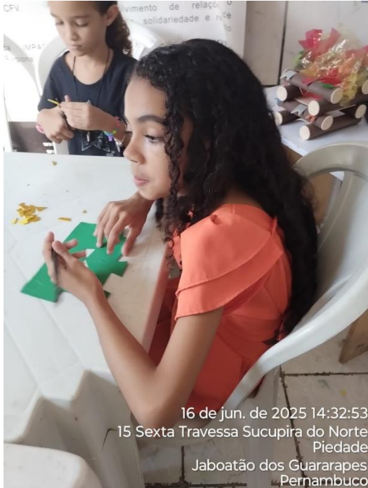
16 de jun. de 2025 14:32:53 15 Sexta Travessa Sucupira do Norte Piedade Jaboatão dos Guararapes Pernambuco