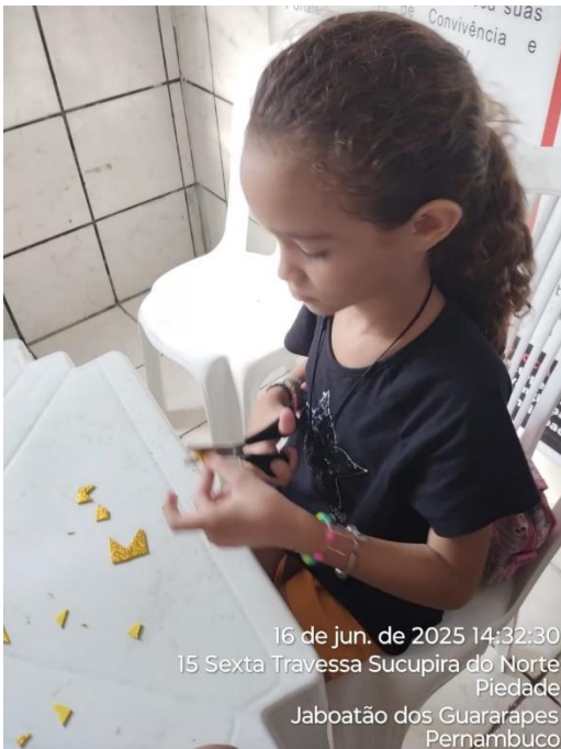
16 de jun. de 2025 14:32:30 15 Sexta Travessa Sucupira do Norte Piedade Jaboatão dos Guararapes Pernambuco