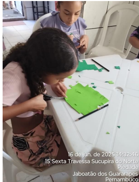
16 de jun. de 2025 14:32:46 15 Sexta Travessa Sucupira do Norte Piedade Jaboatão dos Guararapes Pernambuco