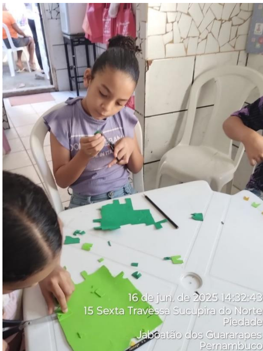
16 de jun. de 2025 14:32:43 15 Sexta Travessa Sucupira do Norte Piedade Jaboatão dos Guararapes Pernambuco