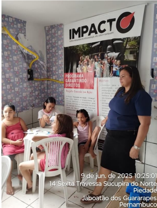
9 de jun. de 2025 10:25:01 14 Sexta Travessa Sucupira do Norte Piedade Jaboatão dos Guararapes Pernambuco