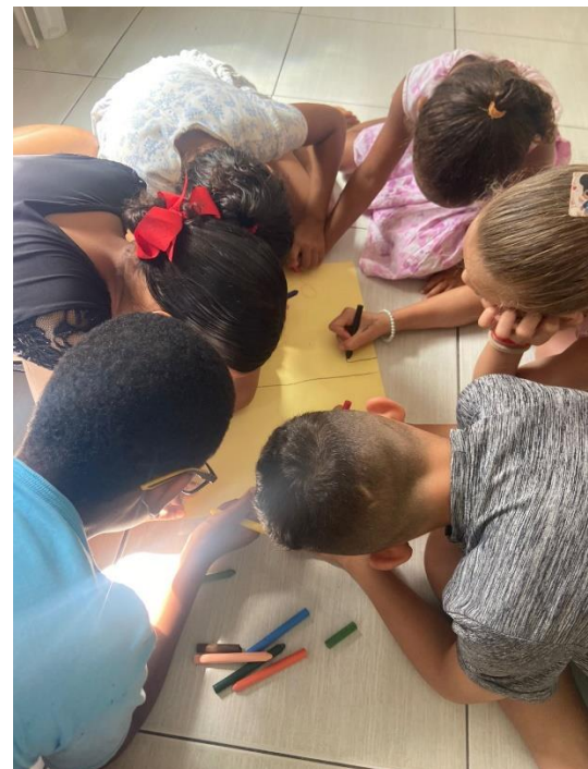
ATIVIDADE DE GRUPO REALIZADO EM 11/06 TEMÁTICA: "COMBATE AO TRABALHO INFANTIL"