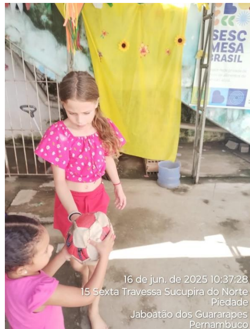
16 de jun. de 2025 10:37:28 15 Sexta Travessa Sucupira do Norte Piedade Jaboatão dos Guararapes Pernambuco