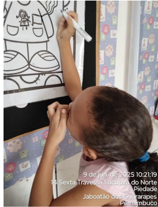
9 de jun. de 2025 10:21:19 14 Sexta Travessa Sucupira do Norte Piedade Jaboatão dos Guararapes Pernambuco