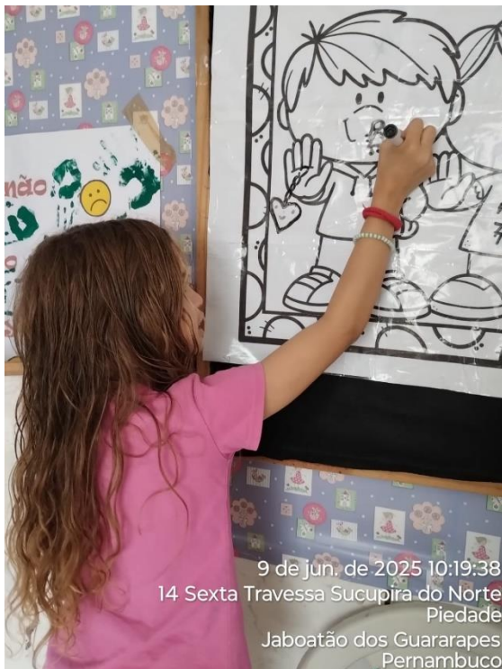
9 de jun. de 2025 10:19:38 14 Sexta Travessa Sucupira do Norte Piedade Jaboatão dos Guararapes Pernambuco