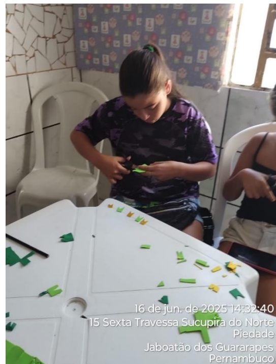
16 de jun. de 2025 14:32:40 15 Sexta Travessa Sucupira do Norte Piedade Jaboatão dos Guararapes Pernambuco