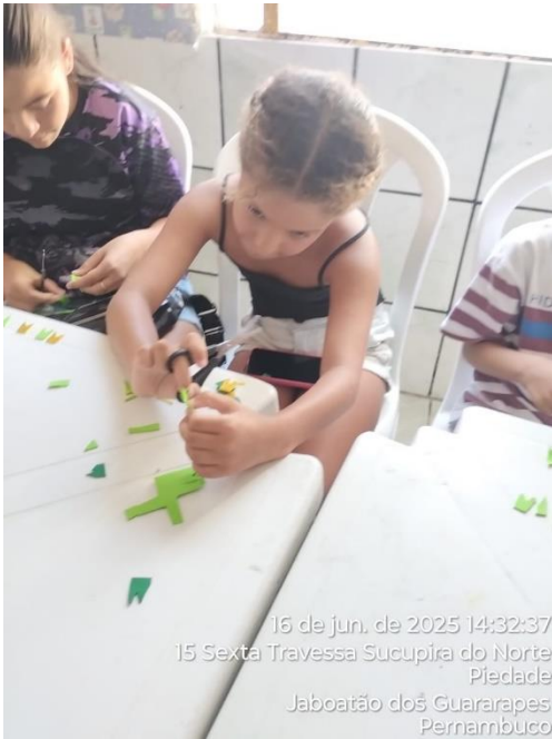
16 de jun. de 2025 14:32:37 15 Sexta Travessa Sucupira do Norte Piedade Jaboatão dos Guararapes Pernambuco