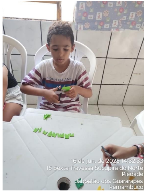
16 de jun. de 2025 14:32:33 15 Sexta Travessa Sucupira do Norte Piedade Jaboatão dos Guararapes Pernambuco